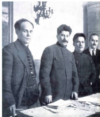
Photo de Staline (la manipulation des images ne date pas d'hier) : Joseph Staline avait pris l'habitude de falsifier des photos, notamment celles sur lesquelles figuraient ses ennemis. Afin de minimiser leur rôle ou importance. Cela prouvait également que Staline n'avait pas été en contact avec des leaders devenus infréquentables avec le temps.